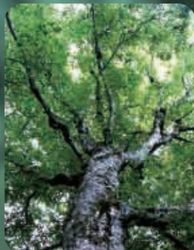
夏のマザーツリー